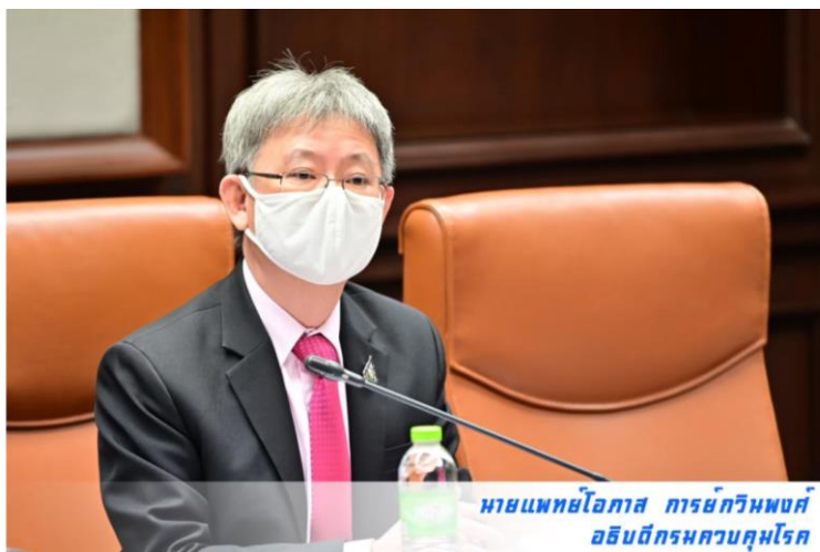
นายแพทย์โอภาส การย์กวินพงศ์ อธิบดีกรมควบคุมโรค

นพ.โอภาส กล่าวต่อไปว่า ประเทศไทยยังไม่มีรายงานผู้ป่วยโรคฝีดาษลิง อย่างไรก็ตามในระยะนี้ เป็นช่วงที่เริ่มเปิดให้มีการเดินทางเข้าประเทศได้มากขึ้น และเป็นช่วงเตรียมการเข้าสู่การเป็นโรคประจำถิ่นของโรคโควิด 19 ดังนั้น อาจมีความเสี่ยงจากผู้เดินทางมาจากพื้นที่ที่มีการระบาด ได้แก่ สหราชอาณาจักรอังกฤษ สเปน โปรตุเกส อิตาลี เบลเยียม ฝรั่งเศส เยอรมันนี สวีเดน สหรัฐอเมริกา แคนาดาและออสเตรเลีย หรือผู้ที่เดินทางมาจากประเทศในทวีปแอฟริกากลาง และแอฟริกาตะวันตกได้ ทั้งในช่องทางการเข้า-ออกระหว่างประเทศ หรือผู้ที่เดินทางจากประเทศดังกล่าวไปในจังหวัดท่องเที่ยวสำคัญต่างๆ จากข้อมูลกองด่านควบคุมโรคติดต่อ ระหว่างประเทศและกักกันโรค กรมควบคุมโรค ได้รายงาน ว่า จำนวนผู้เดินทางที่ลงทะเบียนจากประเทศเสี่ยงสูง ได้แก่ สหราชอาณาจักร สเปน โปรตุเกส โดยระหว่างวันที่ 1-22 พ.ค. 65 นี้ มีผู้เดินทางจากสหราชอาณาจักร จำนวน 13,142 คน จากสเปน 1,352 คน และโปรตุเกส 268 คน