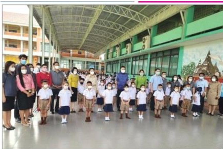
• ตรวจสอบสถานศึกษาเปิดภาคเรียนวันแรก - นายวีระชัย นาคมาศ พ่อเมืองอุบลฯ ประธานนำคณะลงพื้นที่ตรวจ เชิงมาตรการเปิดเรียนภาคเรียนที่ 1/2565 เป็นไปตามกระทรวงศึกษาธิการ ไปโรงเรียนหรือสถาบันการศึกษา เปิดเรียนแบบ On site ณ โรงเรียนวัดใหญ่ชัยมงคล จังหวัดพระนครศรีอยุธยา

ข่าวหนังสือพิมพ์ท้องถิ่น ประจำเดือน พฤษภาคม ๒๕๖๕ หน้าที๑